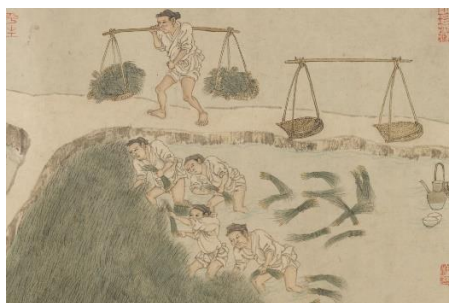
bá yāng chā yāng 拔秧、插秧，将秧苗移插到平整好的水田；