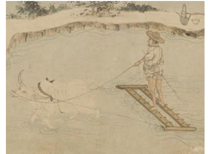
pán ǒu 耙耩，继续整田除草；