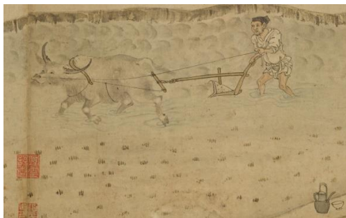
gēng 耕，用犁把土地翻松；