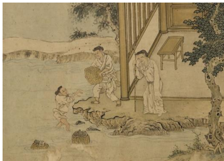
jì nǚ zhǒng 浸种，“泡醒”种子；