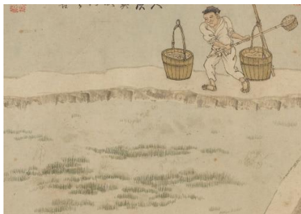
yū yīn 淤荫，拔除杂草、散撒草木灰；