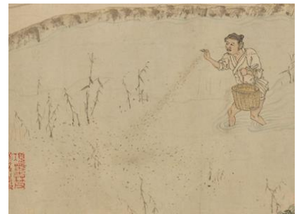
bù yāng 布秧，播种育秧；