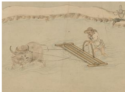
lǜ zhōu 碌碡，把水田弄平整